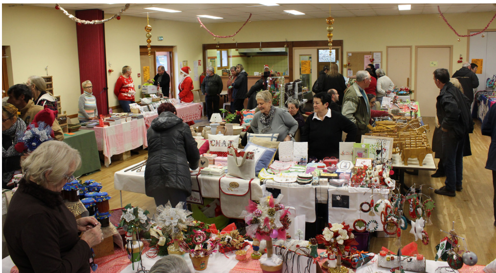
Le marché de Noël, organisé par le Comité des fêtes